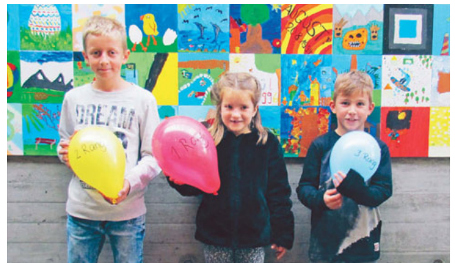
Die strahlenden Sieger des Wettbewerbs

Von den rund 220 Ballons wurden elf Fundkarten zurückgeschickt. Der Ballon der Siegerin wurde in Ennetbühl / SG gefunden und ist somit fast 40 km weit geflogen.