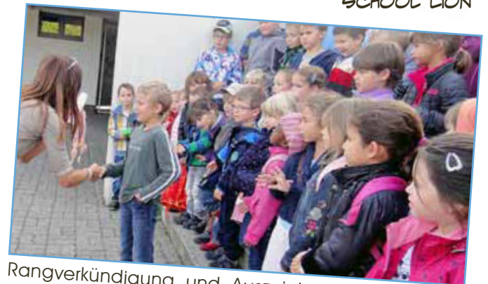
Rangverkündigung und Auszeichnung aller Teilnehmerinnen und Teilnehmer